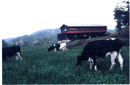
にゅう よう ぎゅう 乳 用 牛