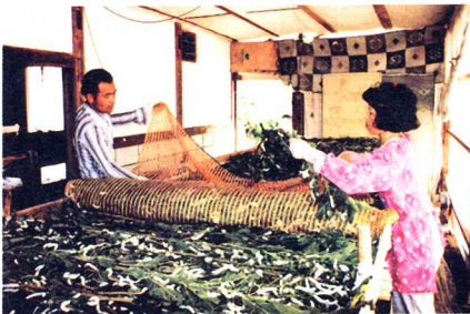
よう さん 養 蚕