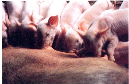
よう どん 養 豚