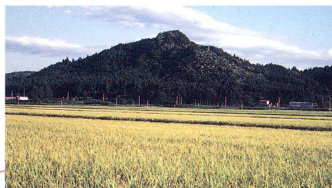
たてほこやまいし いせき 建鉾山祭祀遺跡