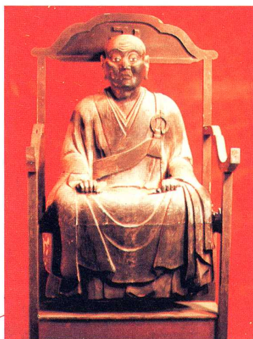
げんおう おしょうぎぞう 木造源翁和尚座像 (600年前)