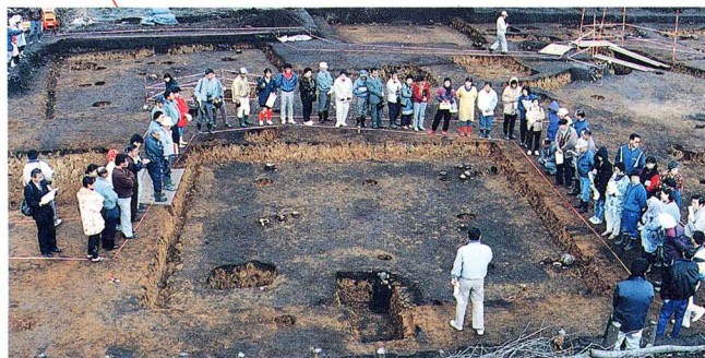
いせき 三森遺跡 (1500年前)