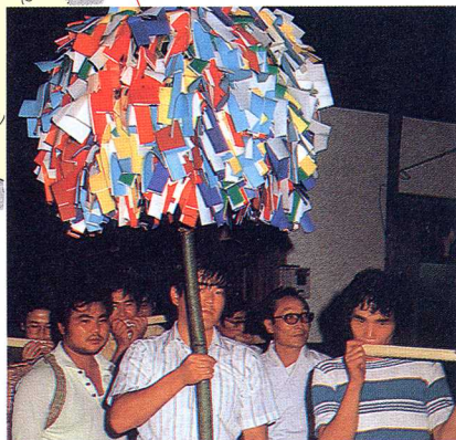
ほん だんまつり 梵天祭