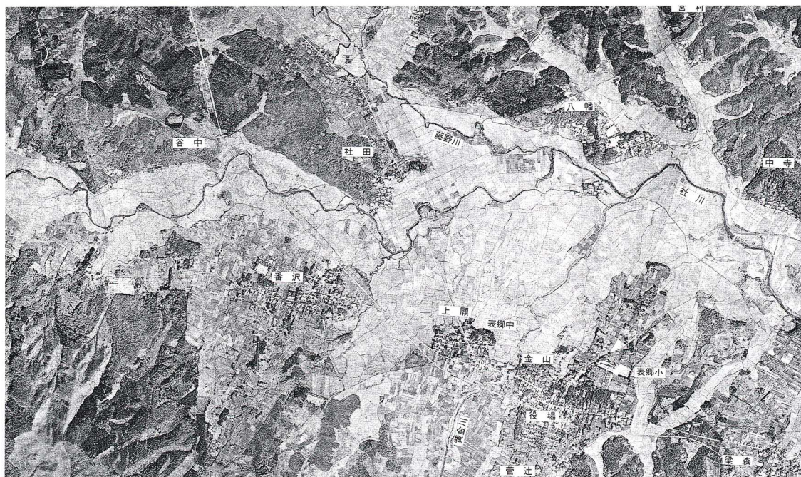
(昭和30年ごろの社川と田のようす)

社川の近くの田は、どろや水がかぶってしまい、たいへんなひが いが出るものがたびたびありました。