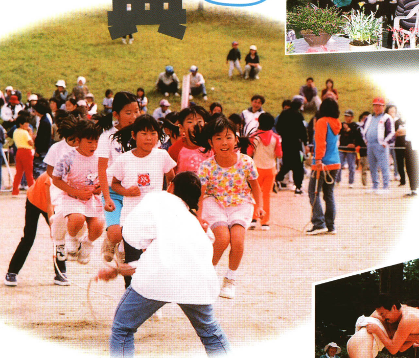
ひがしスポーツまつり