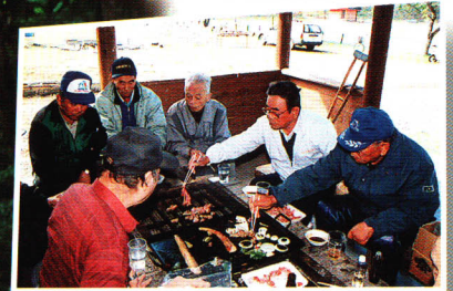
バーベキューハウス