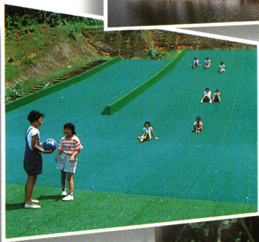
チビッコゲレンデ