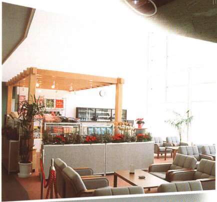
ティーラウンジ、売店