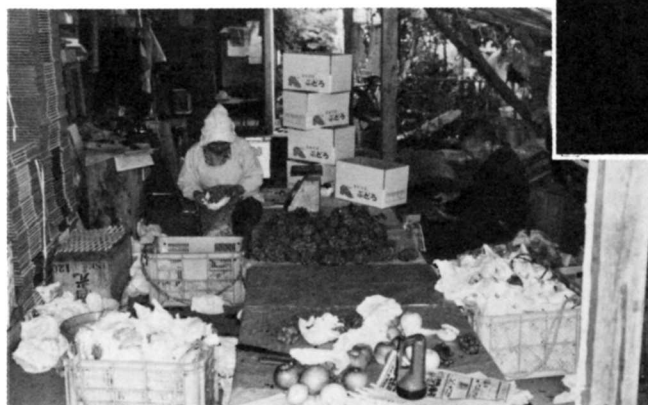
ぶどう・りんごのはこづめ