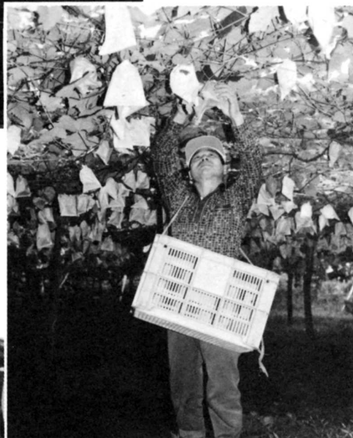
ぶどうのしゅうかく