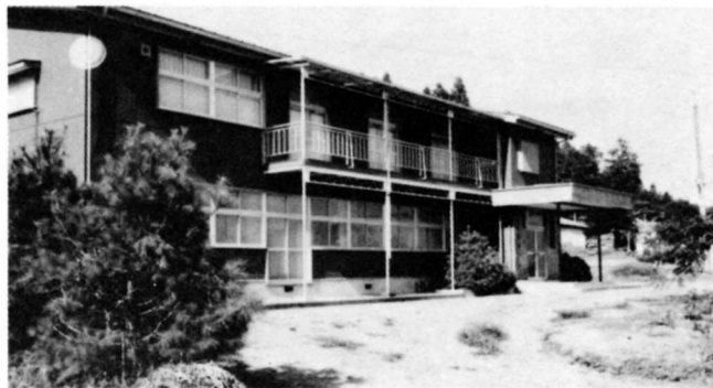
農業後継者センター（市倉）

東村では、農家が 800戸以上あります。米作りを中心に養蚕、たばこ、畜産、果樹栽培などがおこなわれています。