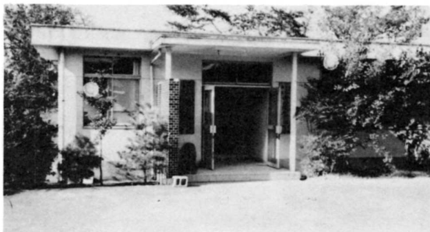
母子健康センター（幼稚園のとなり）