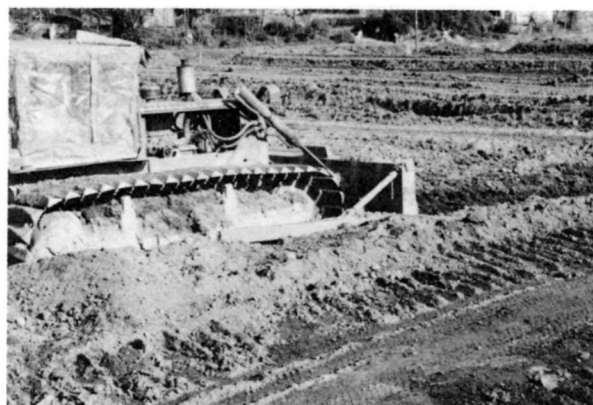
耕地整理のようす(坂口)