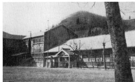
むかしの大屋小学校の校舎（1953年）

1874年 かみごや 上小屋の みんか 民家をかりて、隈戸小学校ができた。その後、隈戸小、大屋小になり、1915年には、滑里川に なめりかわ 季節分校がつくられた。1972年に隈戸小が大屋小と統合した。