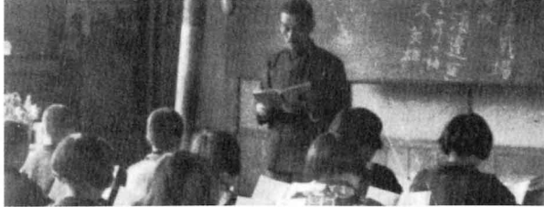
むかしの勉強ふうけい（信夫国民学校時代）1943年