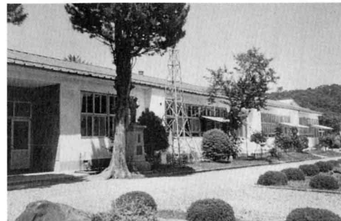
むかしの信夫第一小学校の校舎（1989年）

1873年 しも 下、 なか 中、 かみしんじょう 上新城、 まちや 町屋、 ますみ 増見の五つの村で中新城のお寺をかりた小学校ができた。新城・町屋・増見の3校に分かれ1887年 とうごう 統合し新城小となり、その後信夫小学校になった。1947年に信夫第一小学校となる。