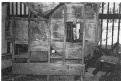
とう み 箕 唐 箕