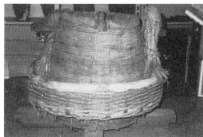
ど す る じ 臼 土 摺 臼