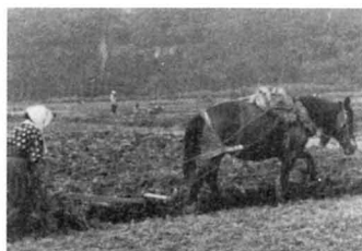
ば こう 馬 耕