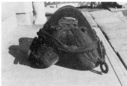
に ぐ ら 荷 ぐ ら

★むかしの農業でつかわれた道具やきかいにはどんなものがあったか、家の人にもきいてしらべてみましょう。