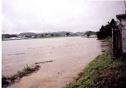
▲一面湖のようになった水田の冠水 (下新城地内)