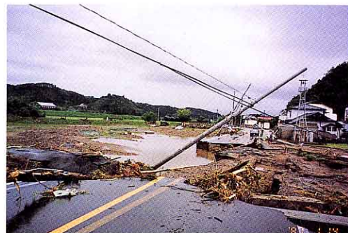
▲道路決壊 (矢吹天栄線堂山地内)