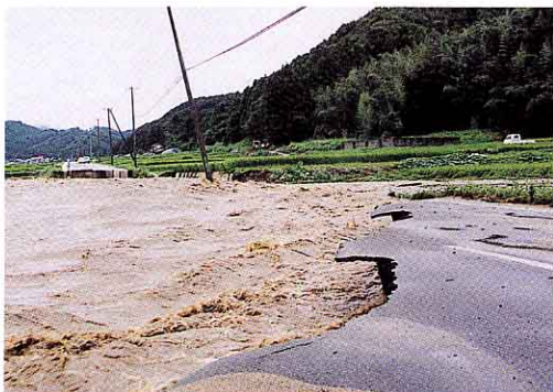
▲氾濫した濁流により道路が決壊 (矢吹天栄線上小屋日向間)