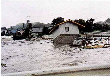
▲急流が倉庫を流し、橋につかえる。 (中新城地内)