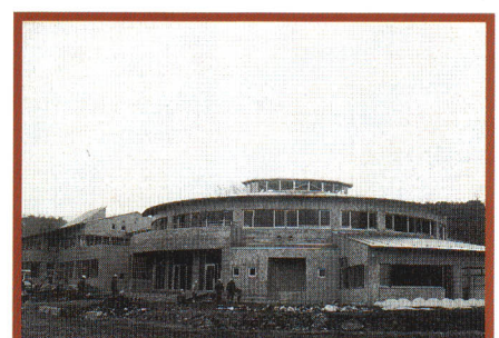
平成9年、珍しい円形の杜川小学校が完成