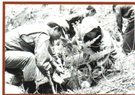
昭和59年、「友好の森林」づくりでの記念植樹