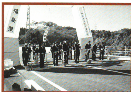
平成12年、国道118号バイパスが開通する