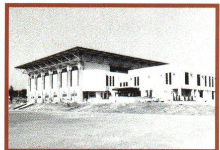
昭和52年、棚倉町総合体育館が完成する