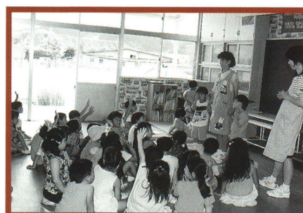
平成11年、棚倉幼稚園で預かり保育がスタート