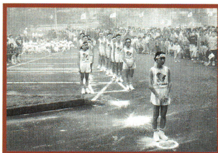
平成7年、第50回国民体育大会(ふくしま国体)開催