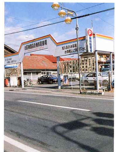
古町南商店街無料ちゅう車場