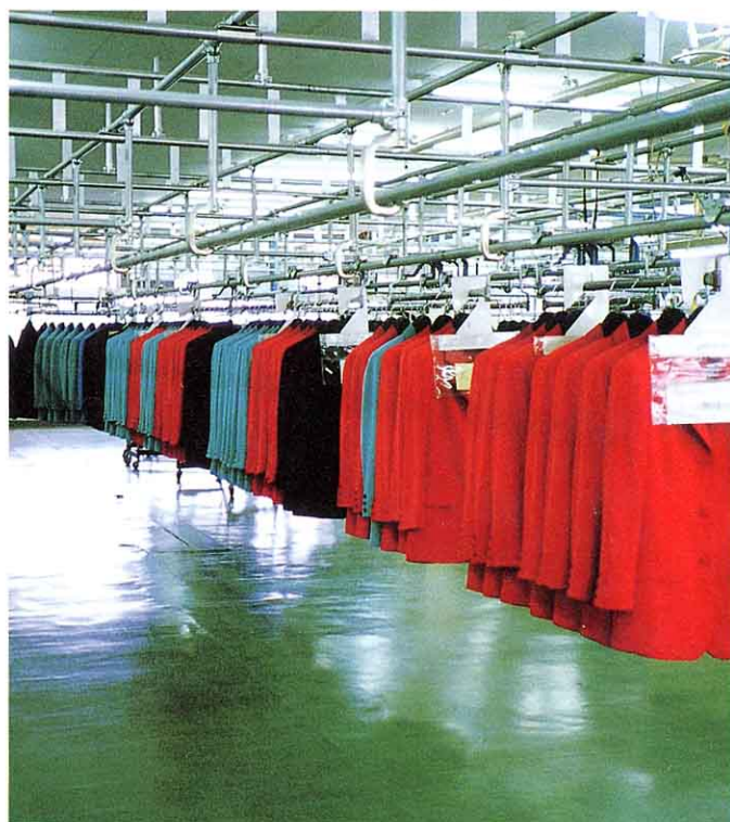
〔レールで そうこ 倉庫へ〕