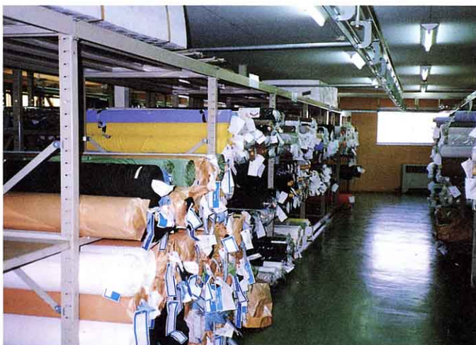
ざいりょう ほかん 〔材料の保管(ぬの地)〕