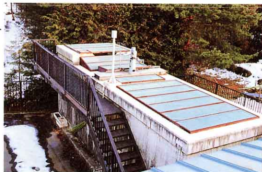
③ 第3取水場及び浄水しせつ