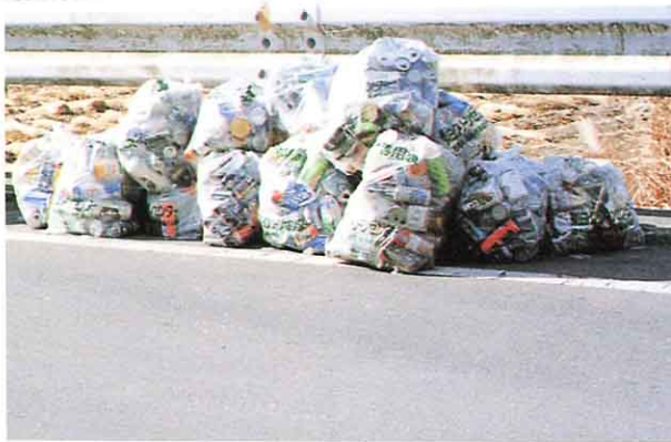
▲道路わきに集められたごみ(関口地内)