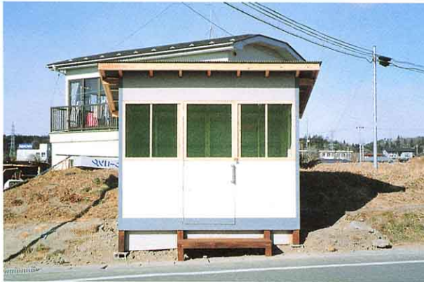
▲ごみ収集小屋(関口地内)