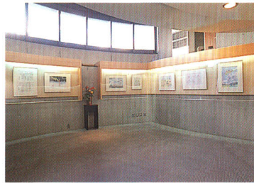
富永一朗はなわ漫画廊