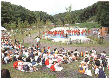
ミステリーツアー