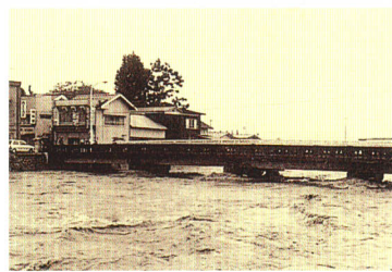
昭和61年 台風10号 川上川(桜木橋)