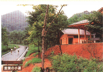
平成6年 塙ふれあいの森にキャンプ施設完成