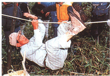
平成元年 小野田自然塾にて