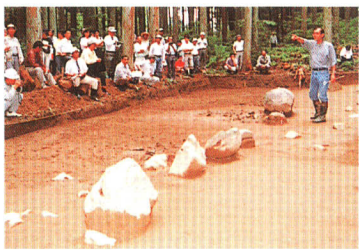
平成3年 羽黒山城跡第一次発掘調査