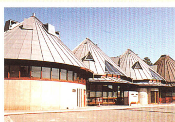
平成5年 塙町コミュニティプラザ完成