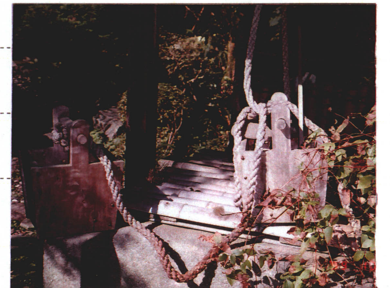
▶ 昔使っていた井戸とつるべ