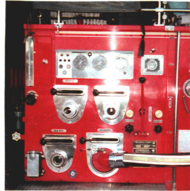
水そう式ポンプ車