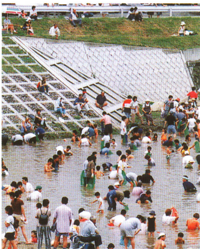
▲鮎と鯉のつかみどり