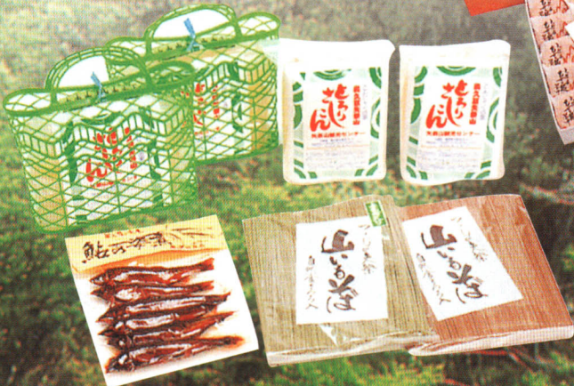
▲刺身こんにゃく 山いもそば 鮎の姿煮