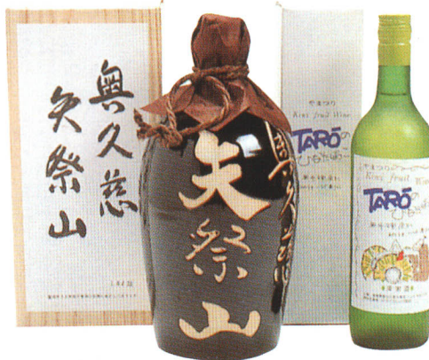
▲地酒とキウイフルーツワイン