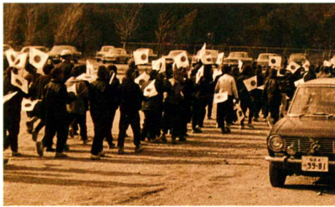
S32. 合併祝賀パレード