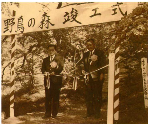
S49. 野鳥の森オープン