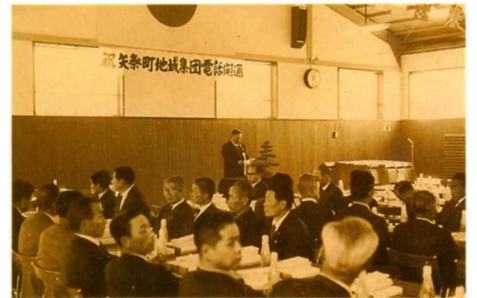
S46. 地域集団電話開通祝賀会