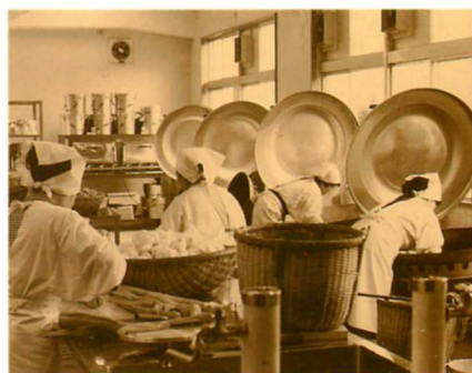
S48. 学校給食センター