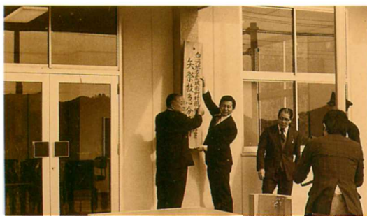
S 54. 救急分遣所完成