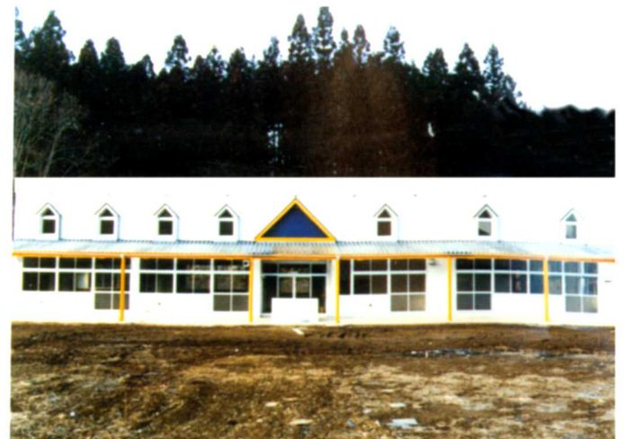
H元. 町立下関河内幼稚園