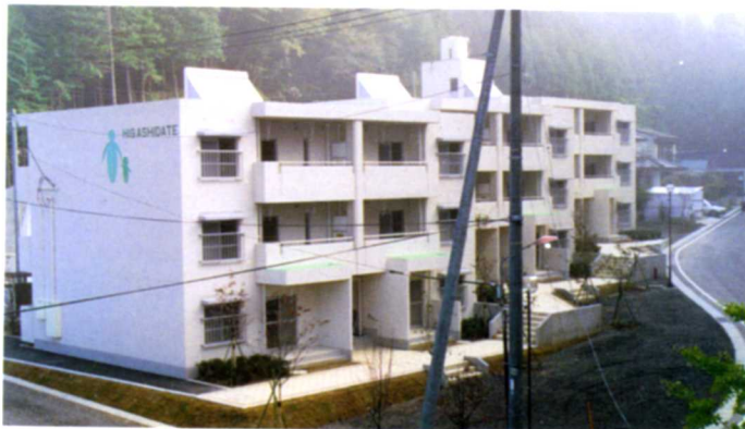
H2. 町営住宅 東館団地