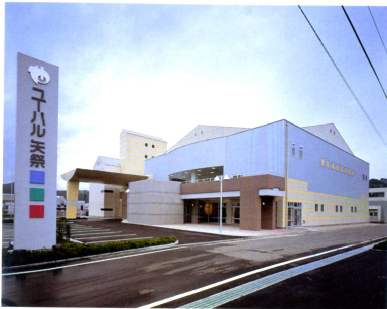
H7. 温泉交流センター「ユール天祭」