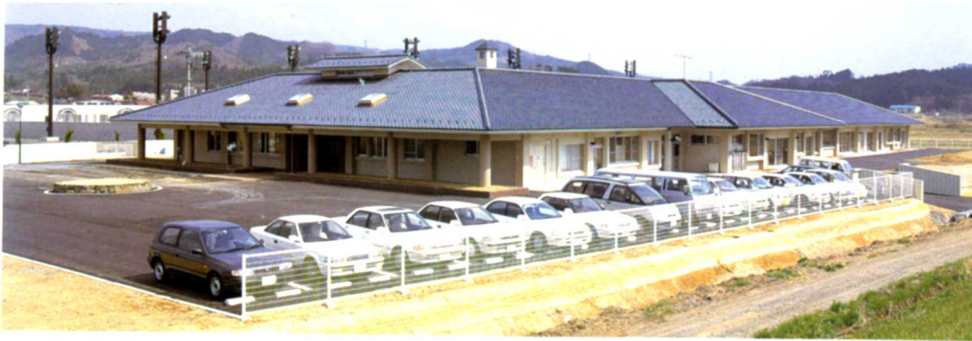
H6. 特別養護老人ホーム「ユーアイホーム」