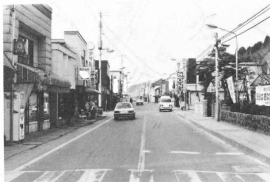
<町の中心、商店のなるぶ通り>