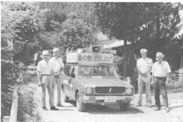
◀大切な木をからさないよう、人々にうたえてまわる人たちがいます。 とうはくせいぎきょうどうくみあい (東白製材協同組合の人びと)