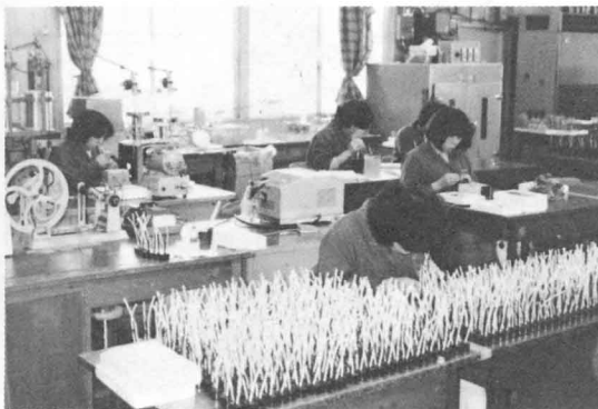
きかいの部品を作る工場 (関岡)