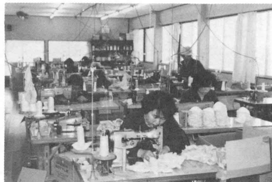
ほうせい工場 (内川)