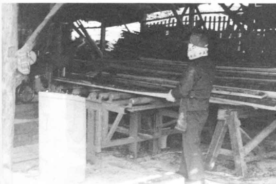
せいざい工場 (東館)