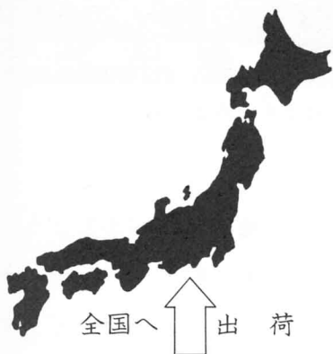
全国へ ↑ 出荷