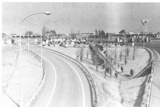
〈東北自動車道の郡山インターチェンジ〉

国道4号、49号線が市を通り、東京や せんだい 仙台、青森、県内では はま 浜通りとのいききも、べんりになってきています。