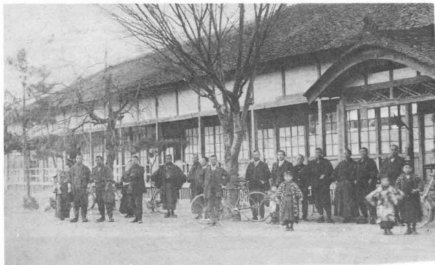
<50年ほど前の校しゃ>

屋根はこばぶきで、まどはガラス戸になりました。このころまどがしょうじ戸の学校もあったのです。この校舎は、ずいぶんむかしにたてられたもので、あちこち、いたんでいました。