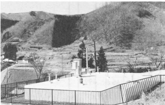
③第2配水池…飲み水をたくわえます。