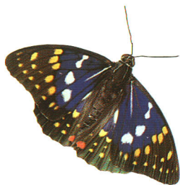
国蝶オオムラサキ

たとえば、冬の沈黙を破るように一斉に花開く「火打石のしだれ桜」の紅と青空のコントラスト。萌葱色に輝く「鹿角平」の若草と白樺林の白。天を仰ぐようにそびえ立つ「西山のイチイ」と木洩れ日。水しぶきをあげて流れ落ちる「江竜田の滝」と錦の紅葉。そして山も、民家も、牧場もすべてをおおい