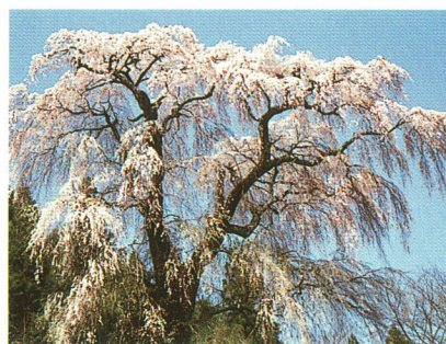
火打石のしだれ桜