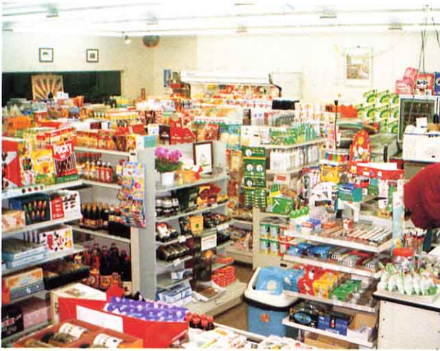
<スーパーの品物のならべてあるようす>