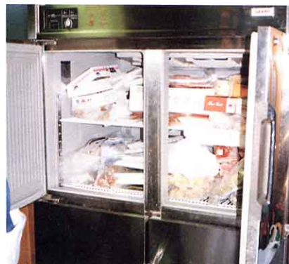
<肉・やさいのれいぞう庫>