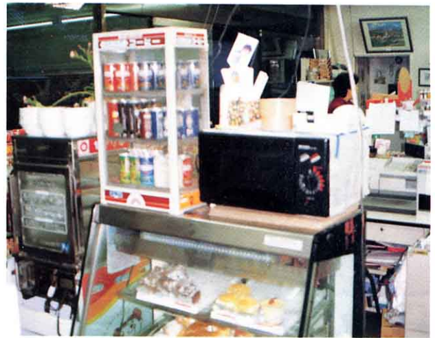
<電子レンジと温かい飲み物>