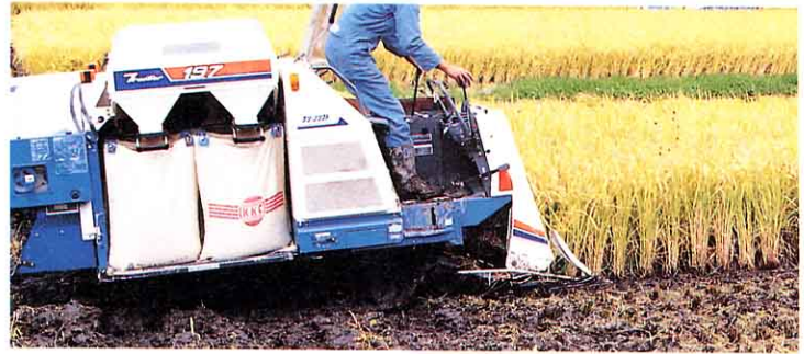
鮫川村の米のとれ高

米作りは、むかしも今もかわらない。鮫川村のだいひょうてきな農業の一つです。コンバインやトラクターなどの大がたきかいを使って、作業を早くおわらせます。