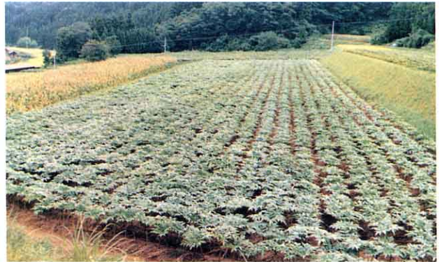
こんにゃくの生産量

こんにゃくは、たねいもをうえつけてからやく3年間かけてしゅっかします。さいばいに時間がかかることと、外国から安いこんにゃくいもがゆにゅうされたことでねだんが下がり、年々作る農家がへってきました。