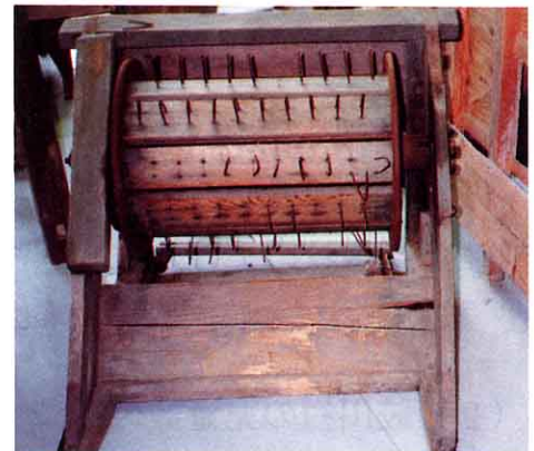
あしぶみだっこき