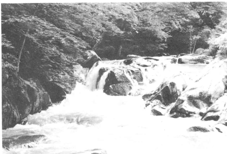
▲四季折々の散策で楽しめる強滝（雄滝）