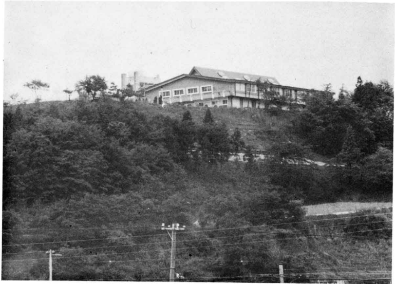
▲湯ノ田より見上げた壇ノ岡（鮫川中学校屋内運動場）