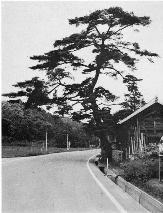
◀ 青葉滝の上手蕨ノ草に響え立つ赤松の老樹