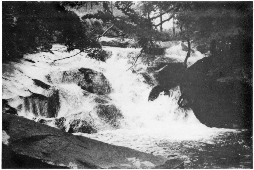
▲黒岩を流れる白い水しぶきが印象的な青葉滝

東野の滝ノ下から蕨ノ草へのぼる国道 349号線の右手下にある古木につつまれた落差五メートル程の滝。滝の右上上の巨石上に石造りの不動明王像が立っている。ことに楓の緑が目にしみる。秋の紅葉時がみもの。