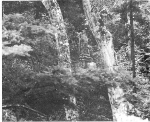
青葉滝右上上に立つ不動明王像▶