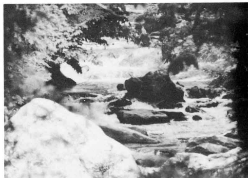
▶葉がくれに見る溪流もよい。