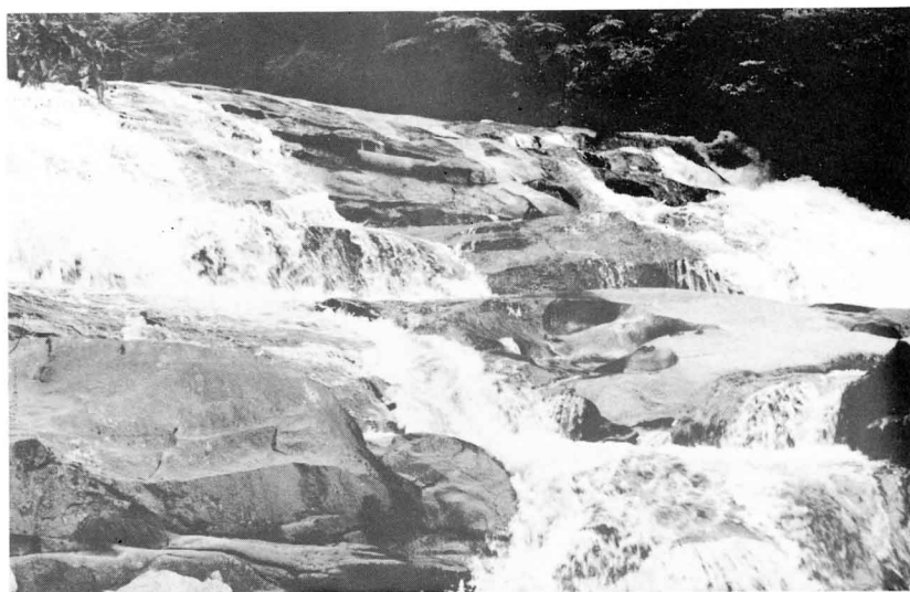
なだらかな岩の斜面を清流が▶ 滑り落ちる滑滝

渡瀬字下部落の日ノ沢橋の手前から渡瀬川を下ります。日ノ沢橋より徒歩五分。写真のようになだらかな岩の斜面を清流が滑る景は、実におごそかで美しい。林道もあり家族連れでどうぞたずねてください。真夏の水しぶきはことのほか涼しい。