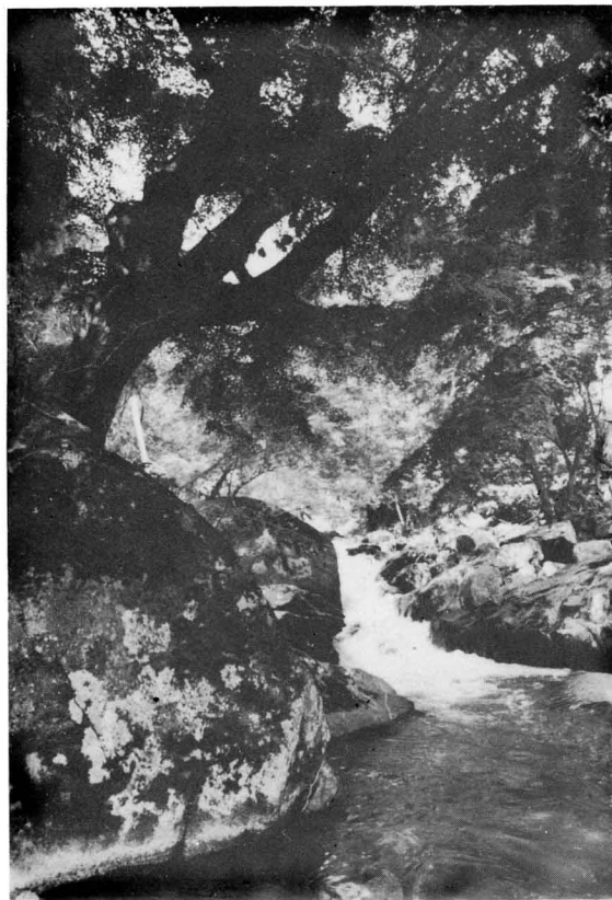
◀楓・岩・清流の調和が素晴らしい。