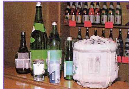
① つくられるせいひんのしゅるい