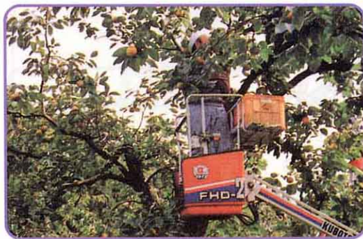
⑥しゅうかくする。〈10月末～11月中旬〉