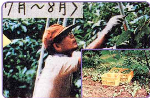
⑤多すぎる実をとる。 〈7月～8月〉