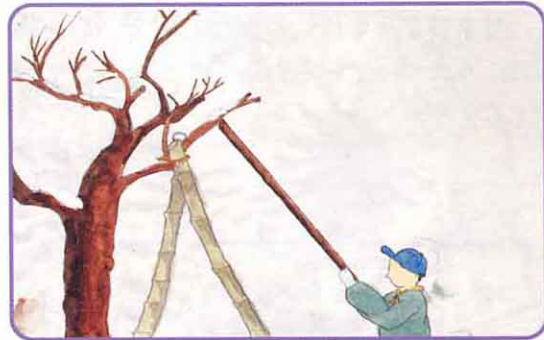
⑧雪おろしをする。支柱でさ さえる。〈1月～3月〉