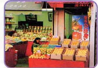
①やおやさんにならべられた会津みしらがき