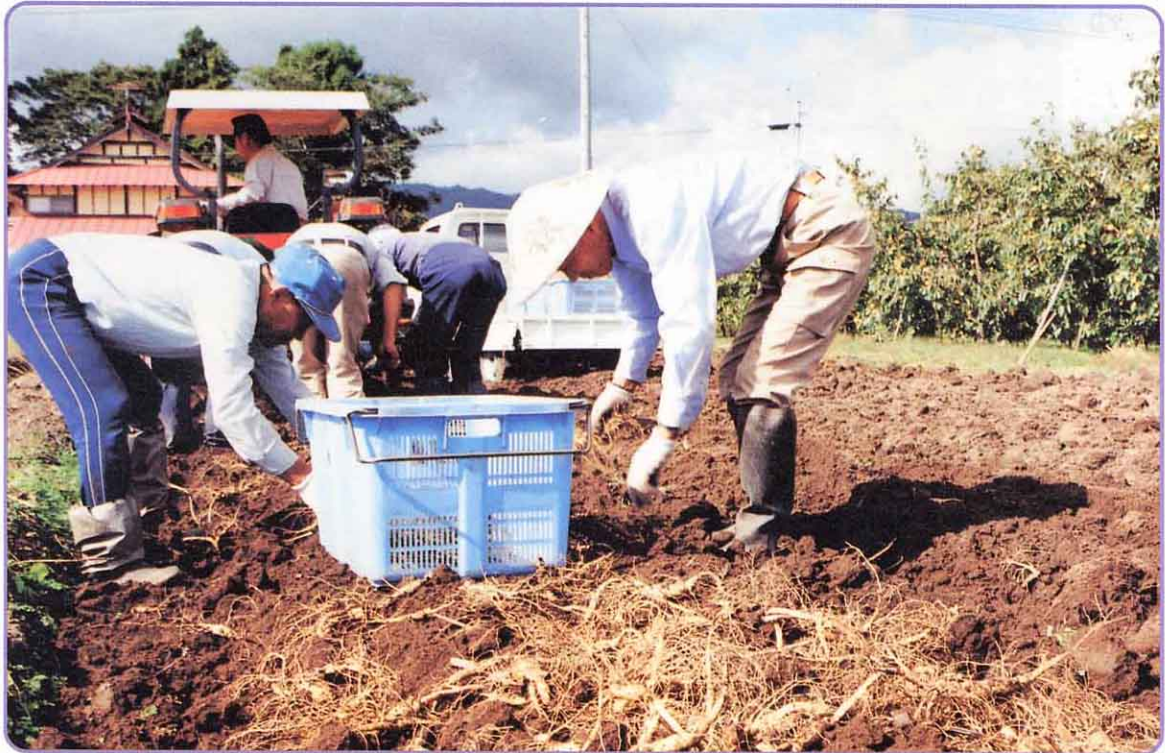
① ちょうせんにんじんのとり入れ