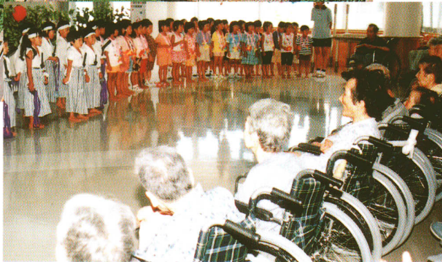
▼デイ・サービス・センター／福祉施設

病院を退院して家庭復帰するまで リハビリを主とする入所型 療養・機能訓練をする施設です。 家庭に戻ったあとも、デイケアなどで、 在宅生活を支援します。