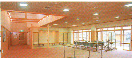
創作室／機能訓練室／休養室