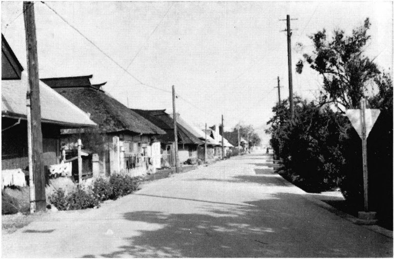
银山街道の開発により地形を直角に横ぎった屋並み（下荒井村）